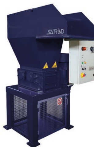
F10 / F15