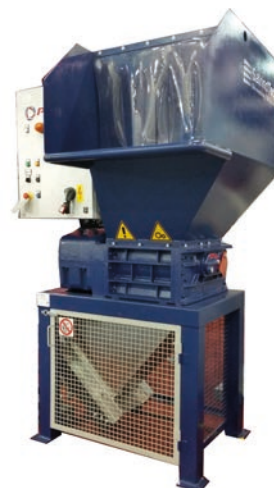
K25 / K30